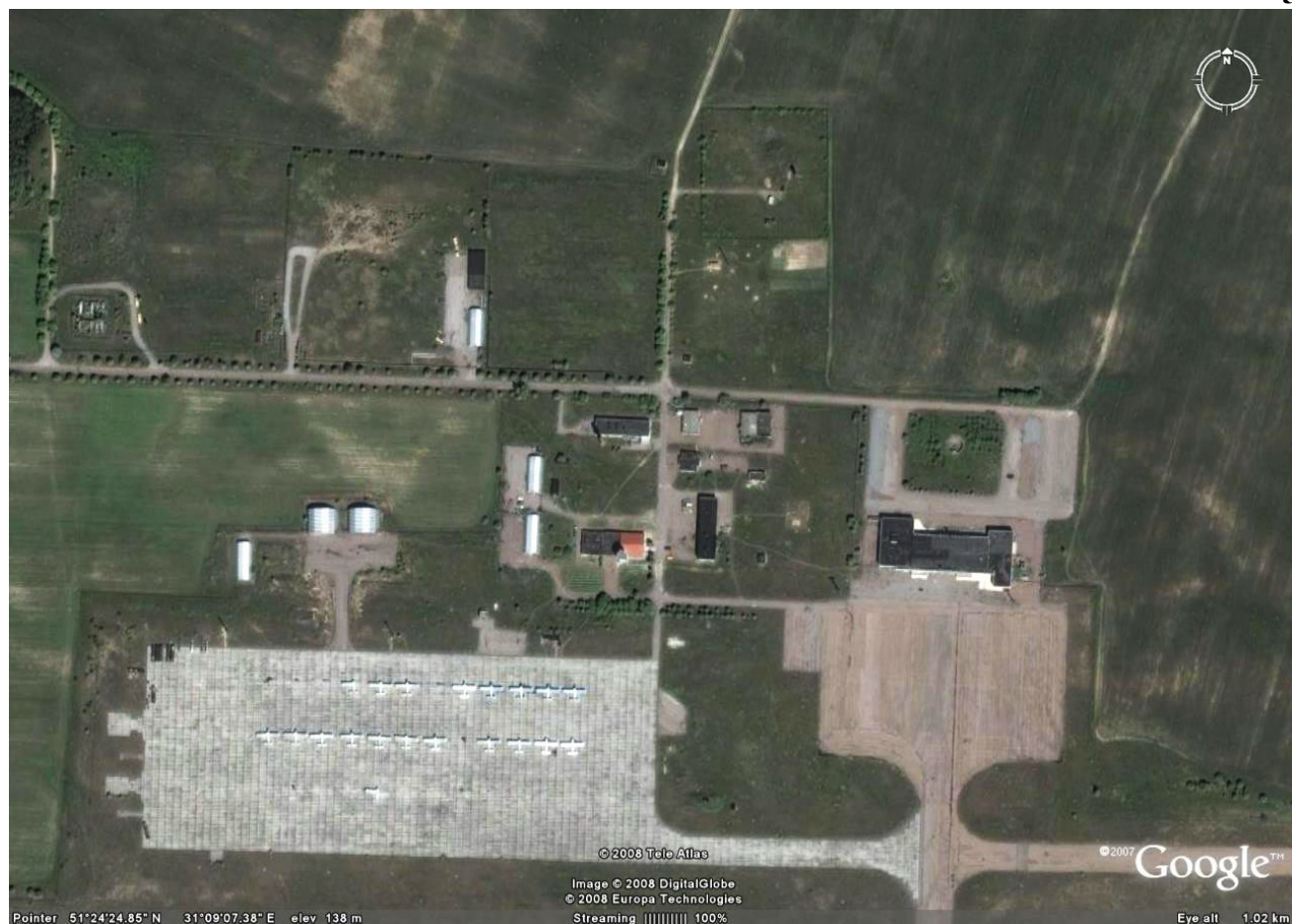
Супутникове фото аеровокзального комплексу аеропорту "Чернігів" с. Шестовиця