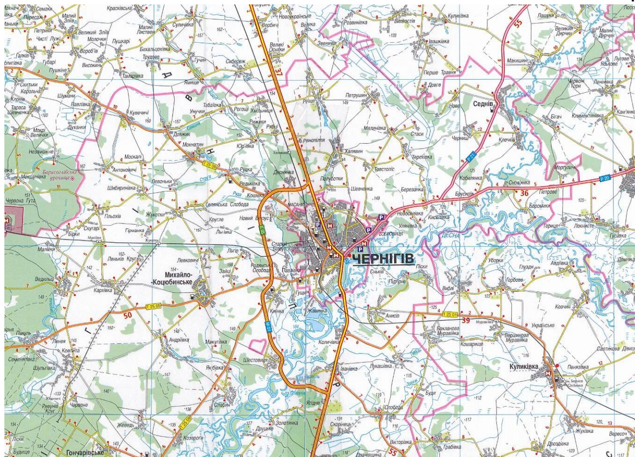
Ситуаційний план розташування аеропорту "Чернігів" по відношенню до міста