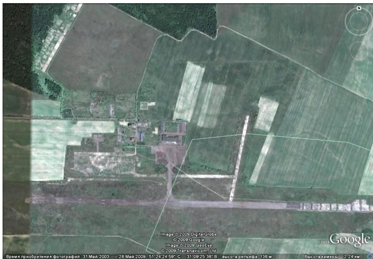
Супутникове фото аеропорту "Чернігів" с. Шестовиця станом на травень 2009 р.