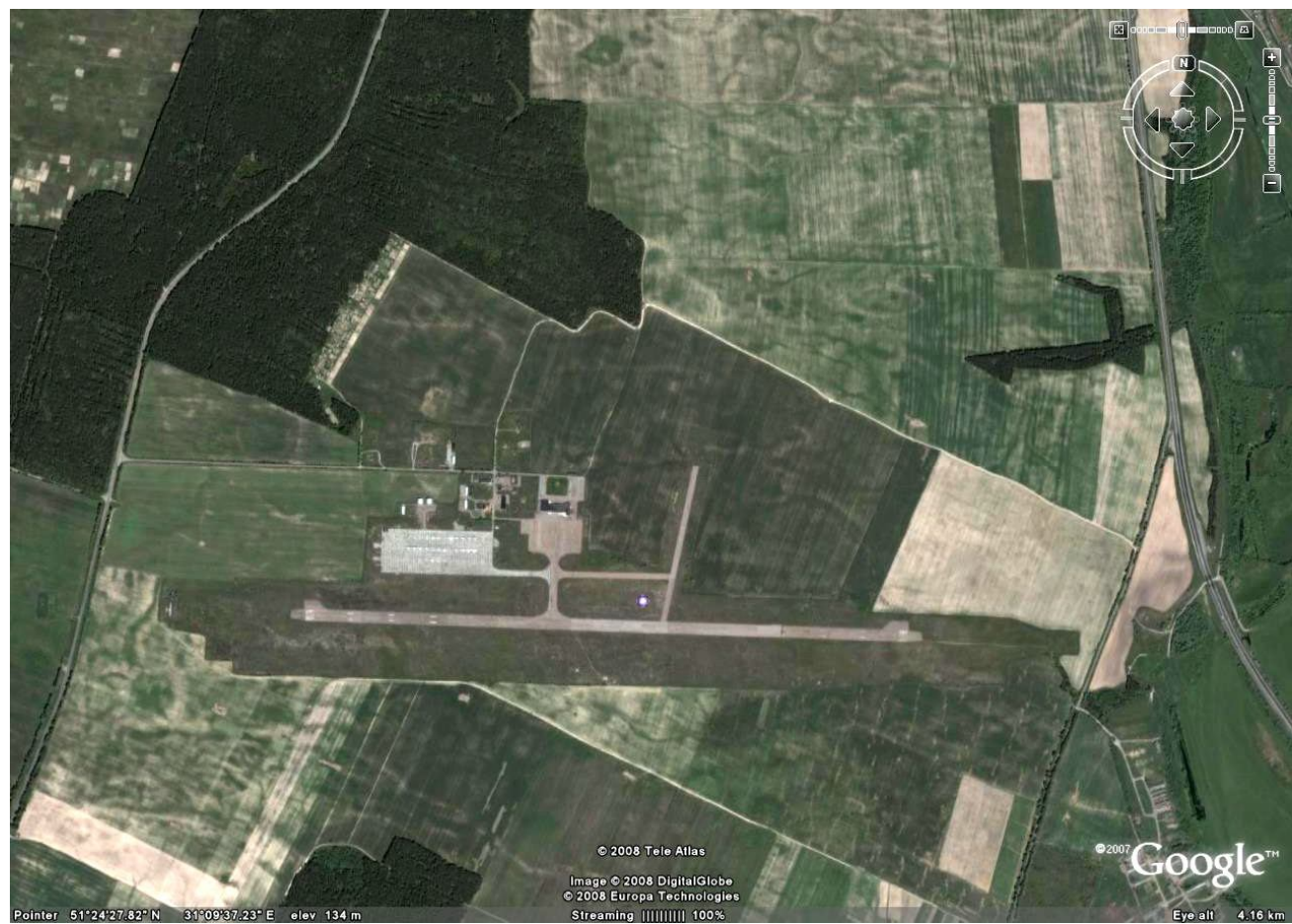
Супутникове фото аеропорту "Чернігів" с. Шестовиця